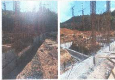
F1: Fachada principal