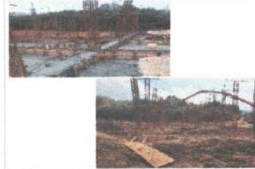
F4: Lateral izquierdo

Observaciones: Mediante Oficio No. AFPEC/OP/FCES/0002/2023, al Instituto de la Infraestructura Física Educativa del Estado de Chiapas, Plomo lo siguiente: En la construcción del módulo de 02 aulas didácticas, se realizó el cobro de zapatas, columnas y cimbra, así mismo, se cuenta con el habilitado de obra de columnas, cimbra y enlage de acero, así como mano de concreto armado.