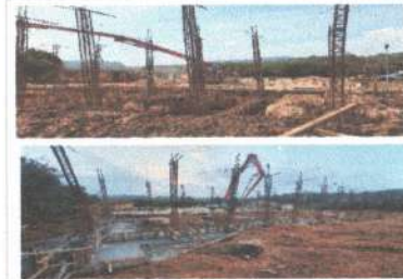
F2: Fachada posterior