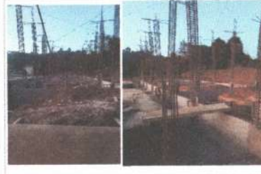
F3: Lateral derecho