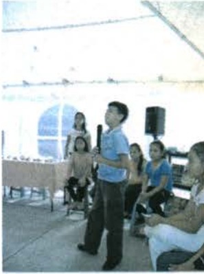
Educación y Capacitación