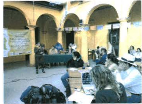
Defensa del agua