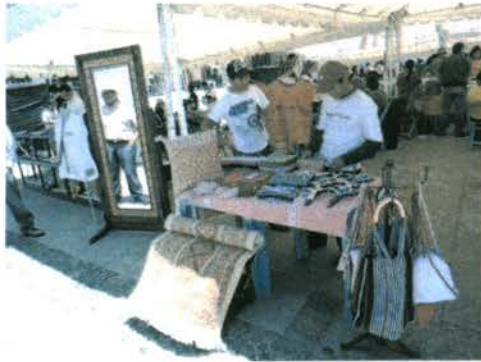
Construcción de Ciudadanía